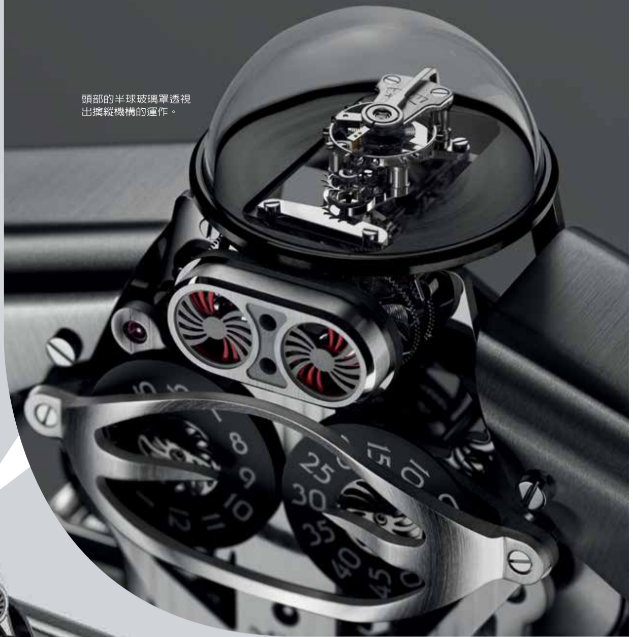
頭部的半球玻璃罩透視出擒縱機構的運作。

作為 Star War 的忠實影迷，Max 從小便渴望擁有一個 R2-D2 般的機器人夥伴。借助 L'Épée 的強大生產能力，MB&F 得以將蒸汽龐克（Steampunk）中的機械人帶入現實世界：透過 Melchior 頭部的半球玻璃罩可見其「神經中樞」——機芯擒縱機構；而 MB&F 將逆跳秒針植入機器人的眼睛，令其實現以 20 秒為週期的眨眼效果，表現出機械人對周圍一切充滿好奇的逼真神態；L'Épée 更特別仿造機械人的胸腔、胸甲、頰骨和脊椎骨的樣式製作鏤空主夾板，令時、分轉盤與動力儲存指示與 Melchior 的軀幹結合得天衣無縫；為令用家清晰閱讀小時讀數，L'Épée 特別研發出「緩慢」跳時機制，使得小時盤只在每小時的最後五分鐘才會緩緩變化；而為機器人提供 40 日續航能力的五個串聯發條亦裸露在外，盡顯機械美感；除此之外，Melchior 更身披閃