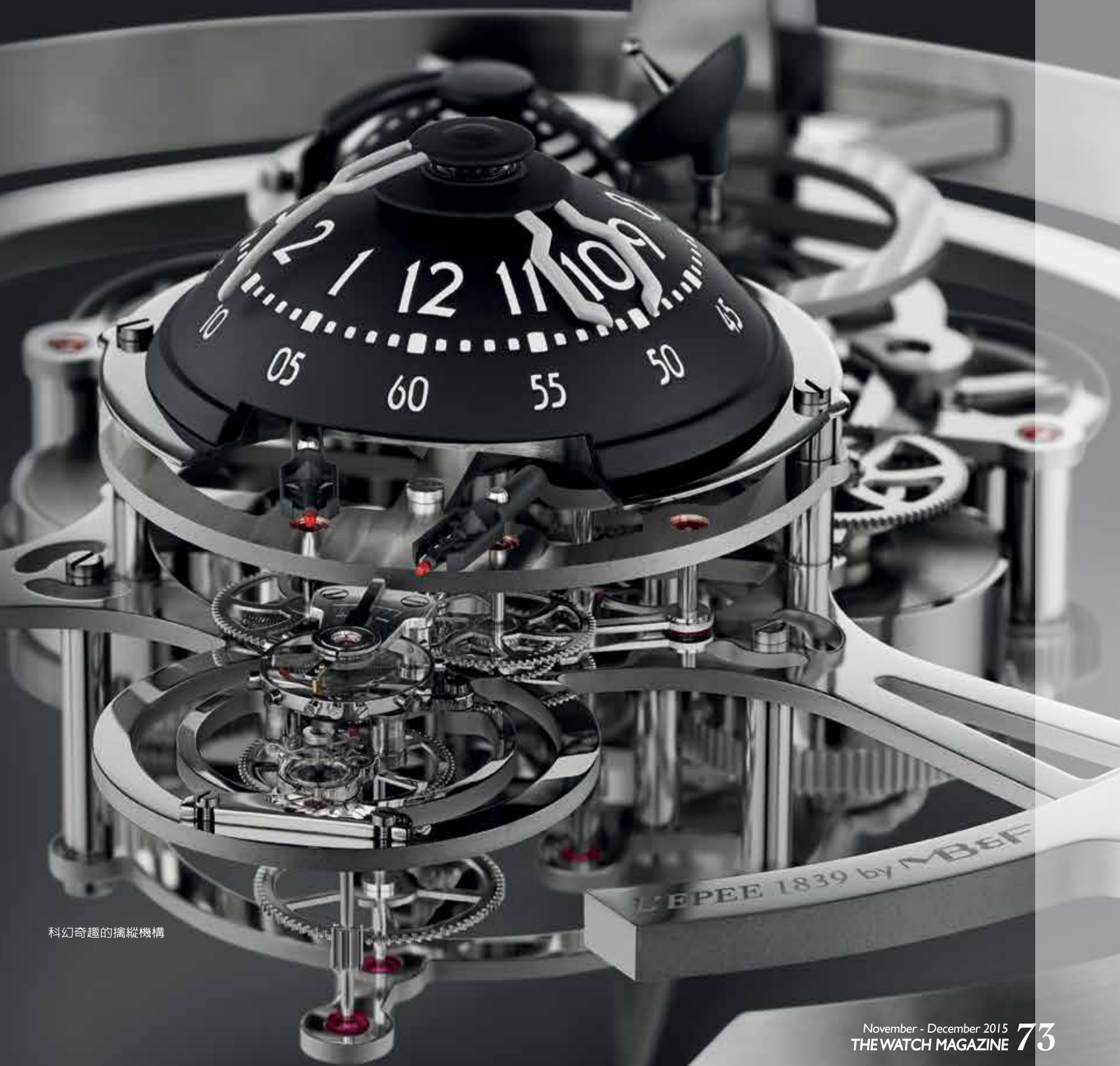
科幻奇趣的擒縱機構