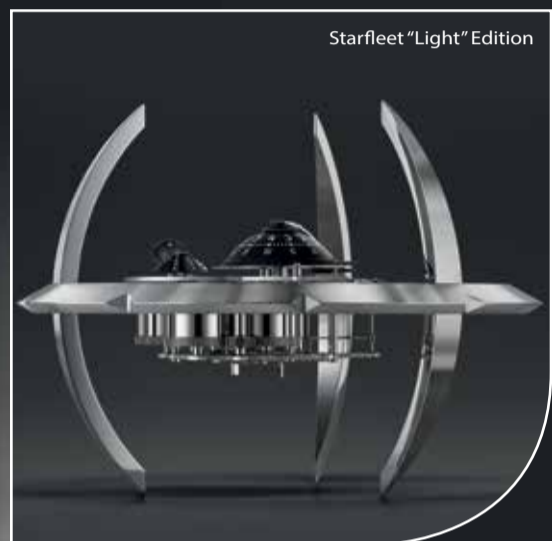
Starfleet "Light" Edition