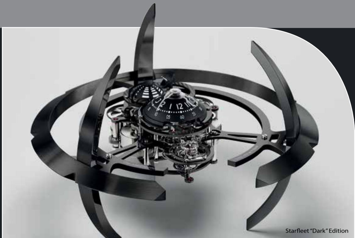
Starfleet "Dark" Edition

作為首個聯名作品，Starfleet 的里程碑意義自然不言而喻。同具赤子之心與創作能量的 MB&F 與 L'Épée 不僅將未來元素引入製表，在某種程度上也是在為機械製表藝術開啓未來。