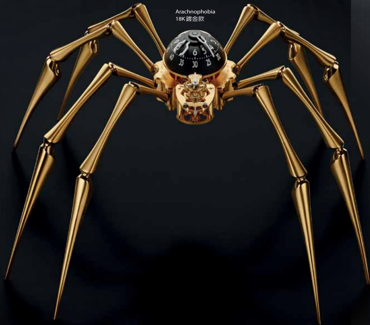
Arachnophobia 18K 鍍金款

新品的簡報會議，我在報告時將放在手上的蜘蛛依牆而附。當時我正在敘述這件令人驚豔的新作品，而將它懸掛在牆上的想法便突然湧現在我腦海中。」這一細節也充分反映出 MB&F 與 L'Épée 之間的合作的確相得益彰。