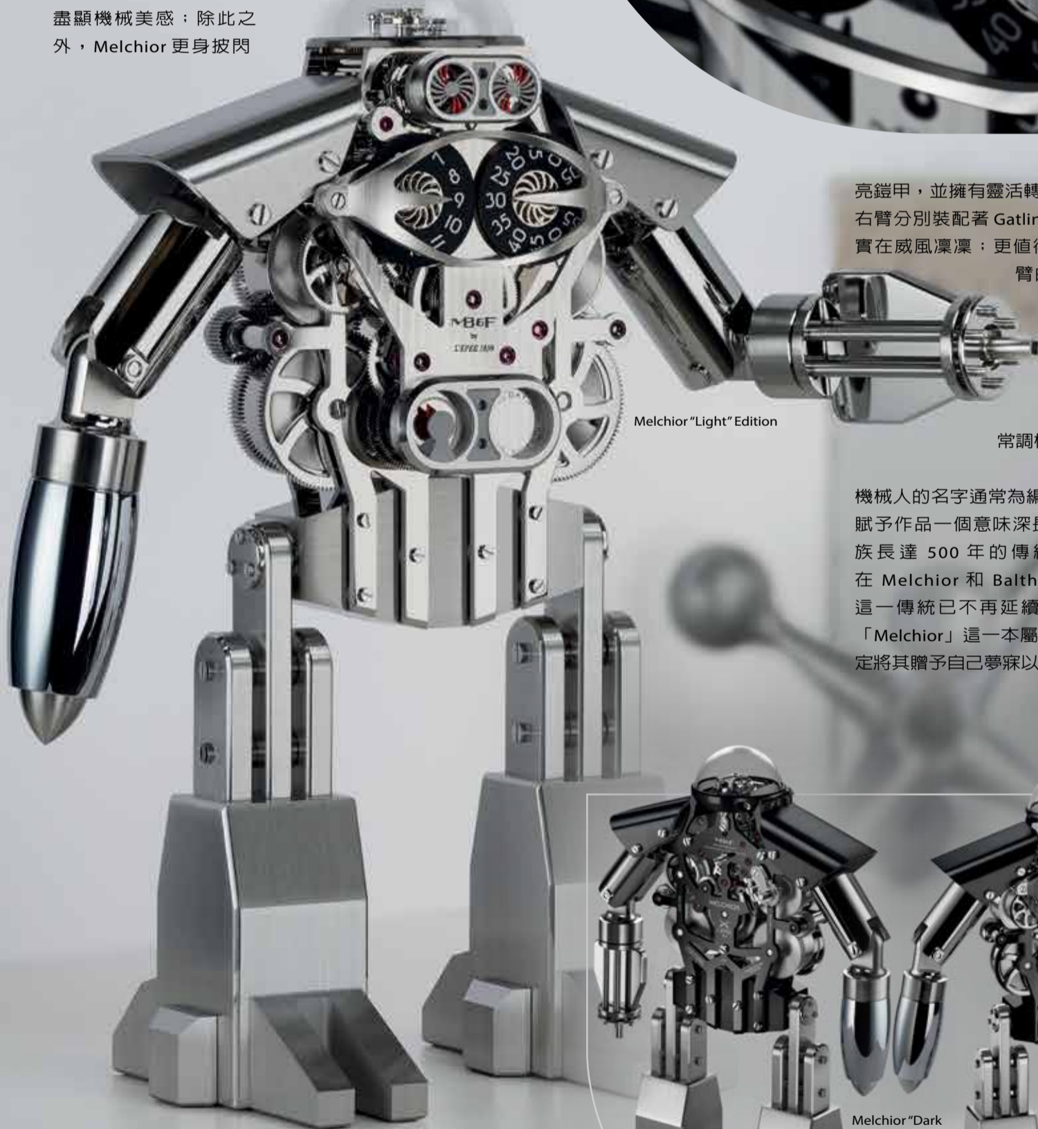
Melchior "Light" Edition

亮鎧甲，並擁有靈活轉動的強健四肢。其左、右臂分別裝配著 Gatling 機槍與火箭發射器，實在威風凜凜；更值得一提的是，機械人左臂的機槍其實是座鐘的上條/校時鑰匙。其通過磁鐵與肘關節相接，取下後便可插入 Melchior 背面的方形調校柱為它進行日常調校。