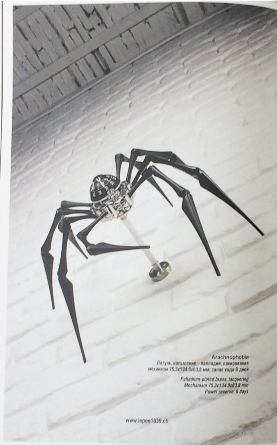
Arachnophobia Латунь, напыление – палладий; лакирование механизм 75.3x134.9x63.8 мм; запас хода 8 дней Palladium-plated brass; lacquering Mechanism 75.3x134.9x63.8 mm Power reserve: 8 days