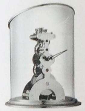
La Tour Латунь, напыление – палладий, диаметр 120 мм, запас хода 6 дней Palladium-plated brass, 120 mm diameter, power reserve: 6 days

For over 175 years, L'Épée has been at the forefront of watch and clock making. Today, it is the only specialised manufacture in Switzerland dedicated to making high-end clocks, often designed in cooperation with MB&F. Arachnophobia was inspired by a giant spider sculpture that Bussier had seen in Geneva. Attached to the abdomen are eight, visually enticing legs. The legs can be rotated so that Arachnophobia can stand tall on a desk or splayed flat for wall mounting. Arachnophobia is available in two colours, black or yellow gold. The black version is more realistic-looking and may be even intimidating to some; the gilded model has a more sculptured artistic appearance. La Tour is inspired by the architectural currents of the early 1920s, with their minimalist approach and is based on ideas from the Bauhaus, an artistic movement built around the creative principle that «function dictates form». La Tour Russian Time model is decorated with the official Coat of Arms of Russia and presented in a limited edition of 250 units which are available in L'Épée Russia only. Melchior model is an impressive kinetic robot which may remind you of Star Wars.