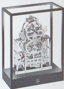
Le Duel Perpetuel Tourbillon Сталь, напыление – палладий, размеры 220x276x110 мм; запас хода 40 дней Palladium-plated steel Dimensions: 220x276x110 mm Power reserve: 40 days

модернисткой волны XX столетия. Модель «La Tour Russian Time» украшена официальным гербом России. Специальный лимитированный выпуск из 250 единиц сейчас доступен в сети L'Epée 1839 только в России. Модель «Melchior» – то ли игрушка, то ли дронд из «Звездных войн». Доспехи из стали и латуни с палладиевым покрытием, загадочное мерцание в глазах, работающие детали под прозрачным шлемом, движущиеся циферблаты... Но все же это не робот, а эксклюзивные настольные часы класса люкс с двойным ретроградным секундным указателем и запасом хода на 40 дней, выпущенные ограниченной серией 99 единиц. Скрещенные шпаги – логотип бренда – прекрасно обыграны в модели «Le Duel Perpetuel Tourbillon», волшебный механизм которой заключен в стеклянный сосуд. Шпаги над числом 12 устроят романтическую дуэль, а вечный