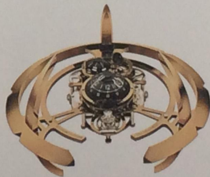
Starfleet Machine Сталь, латунь, напыление – палладий, диаметр 290 мм, запас хода 40 дней Stainless steel, palladium-plated brass 290 mm diameter, power reserve: 40 days

200 gilded pieces (gold-plated) and 50 diamond-set gilded pieces. «Starfleet Machine» is a spaceship-cum-table clock equipped with the double retrograde seconds in the form of turret-mounted laser cannons. «Starfleet Machine» is limited to 175 pieces and is available in «light» or «dark» editions. Sophisticated, almost extraordinary design and an impressive power reserve of L'Epée clocks are intended to shock, evoke and inspire people. L'Epée is the clock of the influential and powerful; among them Winston Churchill, John Kennedy and Pope John Paul II.