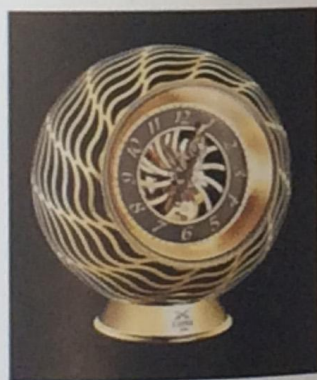
Two Hands Double Flying Tourbillon Медь, напыление – золото, эмаль, диаметр 290 мм, запас хода 40 дней Gold-plated copper, enamel, 290 mm diameter Power reserve: 40 days

but also happens to be 480-component mechanical table clock with double retrograde seconds and a 40-day power reserve; limited to 99 pieces, available in a monochromatic «light» edition or a two-tone «dark and light» edition. Crossed swords take on a special role in «Le Duel Perpetuel Tourbillon» model. At 12 o'clock, the double retrograde seconds showcase two crossed swords. The mechanism is protected by a glass case. The swords, highly evocative of a battle with time, are the emblem of the brand's collection. The «Le Duel Perpetuel Tourbillon» is a limited edition of 99 pieces available in two versions: Palladium or black gold. «Two Hands Double Flying Tourbillon» models, one in massive 30 kg titanium and one in 70kg massive gold-plated brass, created to celebrate the 175th anniversary of L'Epée. The gears and mainspring barrels are on full display thanks to the skeletonized Aerospace Turbine dials, with the mechanism with a 40-day power reserve and two «flying» tourbillons. «Sherman» robot doesn't walk, but with his rubber caterpillar tracks he can roll over the rugged terrain of a typical office desk. «Sherman» is launched in limited editions of 200 palladium (plated) pieces.