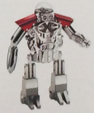
Melchior Сталь, латунь, напыление – палладий, 303x217x112 мм, запас хода 40 дней Stainless steel, palladium-plated brass, 303x217x112 mm, power reserve: 40 days

Эксклюзивность и техническое совершенство – отличительные черты изделий швейцарской компании L'Épée 1839, специализирующейся на производстве элитных часов, дизайн которых нередко разрабатывается в сотрудничестве с MB&F. На создание Arachnophobia авторов вдохновила гигантская скульптура паука, установленная в Женеве. Высотехнологичный механизм состоит из головки и брюшка паука. К брюшку присоединены восемь членистых ног, с помощью которых часы устанавливаются на столе или крепятся к стене. Модель представлена в двух вариантах: черном и золотом. Версия черного цвета более реалистична и может напугать, а с покрытием из желтого золота – более концептуальна и художественна. Дизайн La Tour основан на идеях Баухауса, отражающих творческий принцип «функция диктует форму». Часовой механизм с мостами, заключенный в прозрачную стеклянную колбу, – идеальная иллюстрация